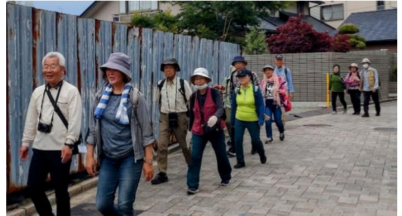
本日の案内人の二人です